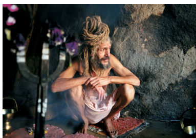
« Hippié Masala »

« Les maîtres fous » [1956 | 28'] Documentaire réalisé par Jean Rouch, France, Les films de la Pléiade.